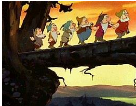
Blanche-Neige et les Sept Nains, réalisé par Walt Disney en 1937, est le premier long métrage animé sonore et en couleurs.

Mais le vrai tournant est l'année 1929 : toutes les salles s'équipent, car le public veut du cinéma parlant. Les scènes mimées cèdent la place au dialogue : les acteurs sont désormais des comédiens. Le spectacle n'est plus le même !